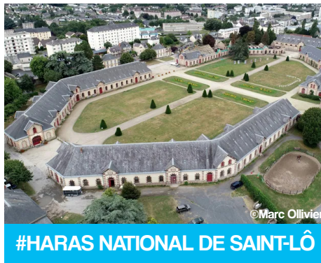
#HARAS NATIONAL DE SAINT-LÔ