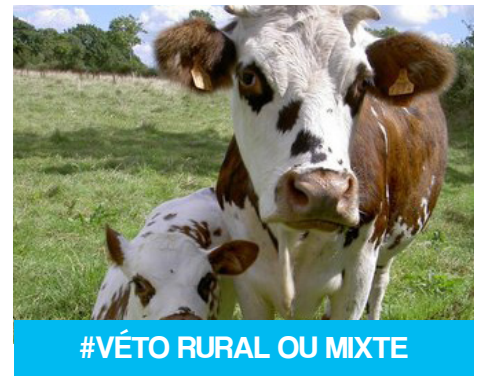
#VÉTO RURAL OU MIXTE